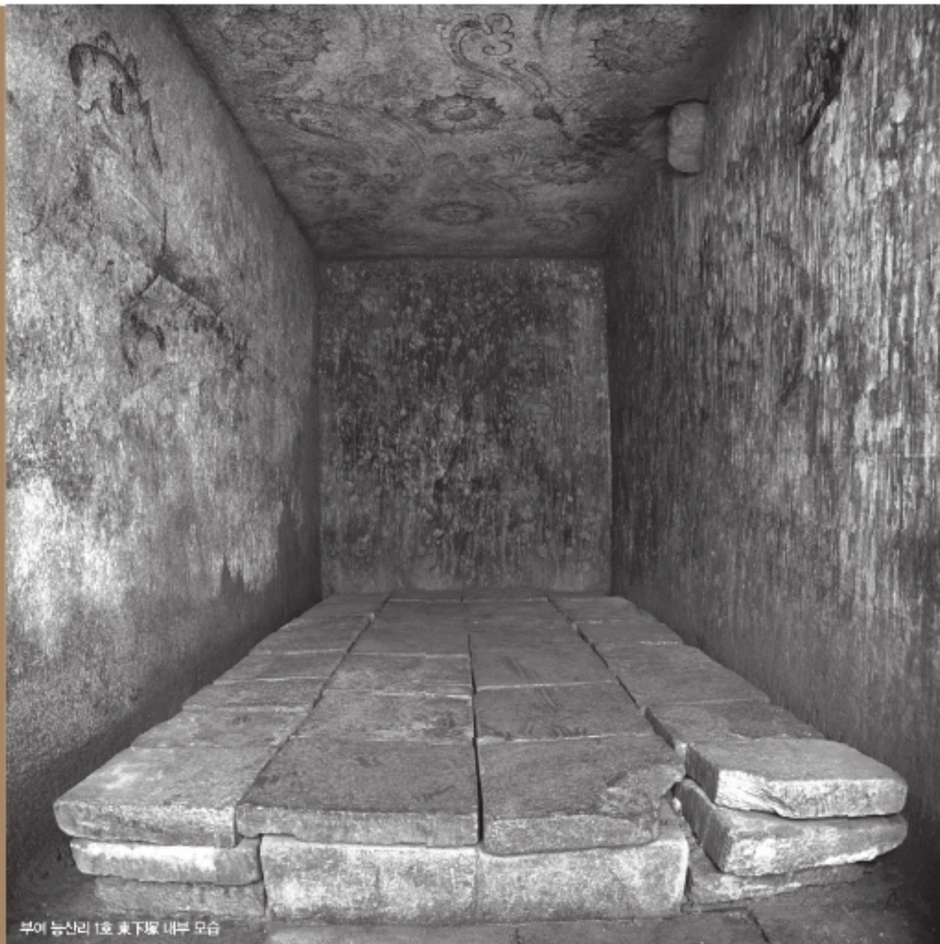
부여 능산리 1호 東下塚 내부 모습